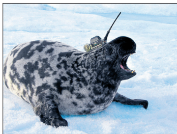
Selene fanges på isen, og blir påsatt måleutstyr. Målerne faller av når dyrene skifter pels om et år.

Viktige brikker. Halvparten av de norske forskingsselene